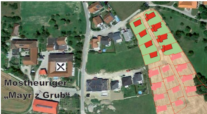
Lageplan der Parzellen (rote Gebäude) in Grub.