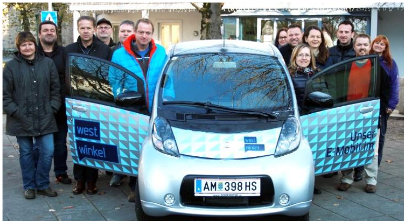
Das kostenlos auszuleihende E-Auto mit Gemeindevertretern des Westwinkels.

Abholungen sind Mo-Do (8-16 Uhr) möglich. Das Auto darf maximal für einen Tag ausgeliehen werden und ist bis spätestens um 16 Uhr am Abholtag bzw. um 7.30 Uhr am Folgetag der Gemeinde im Beisein eines Gemeindeglieders zurückzugeben (Posthof). Eine Autonutzung am Freitag, Samstag oder Sonntag ist je nach Vereinbarung möglich. Bei Abholung ist der Führerschein vorzuweisen, danach folgt eine kurze Einweisung durch einen Gemeindeglieders. Eine Anmeldung ist ab sofort direkt am Gemeindeamt bzw. telefonisch (Tel.: 07432/2214) möglich.