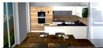
Küchenvorschau des Architekten.

Neuigkeiten zum Wohnprojekt Sun`seitn in Grub: Die 20 Parzellen sind 460–553 m 2 groß und sind zu einem Kaufpreis von 52 €/m 2 (exklusive Aufschließungs- und Anschlusskosten) zu erwerben. Auf den Baugrundstücken sollen Comfort-Zone-