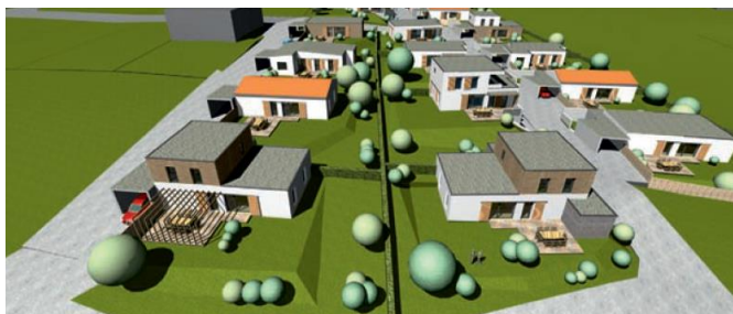
So sollen die Gebäude auf der „Sun‘Seitn“ angeordnet werden.