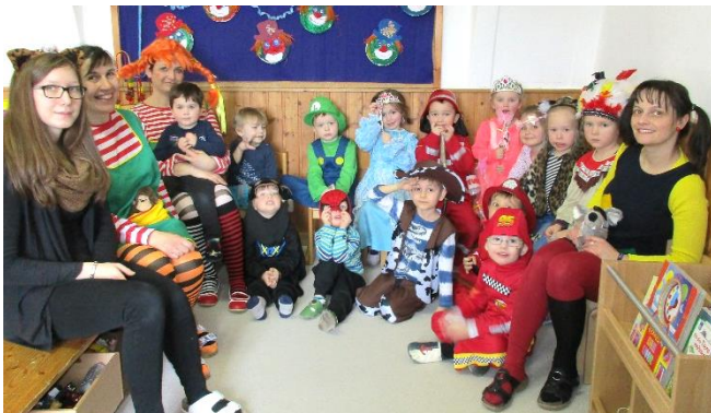
Während ein neues Modell zur Nachmittagsbetreuung beschlossen wurde feierte die 4. Kindergartengruppe den Fasching.

Hinweis: Der Kindergartenbesuch von 07:00 Uhr bis 13:00 bleibt wie bisher kostenlos.