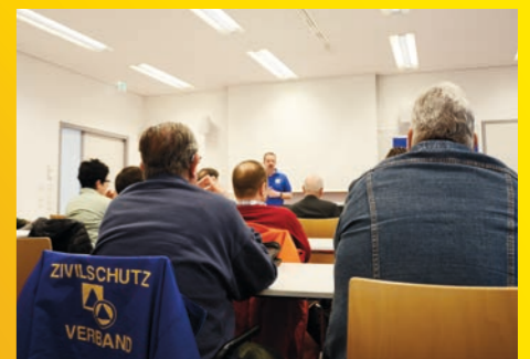
Vorträge und Workshops