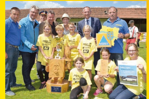
Safety-Tour für Kinder