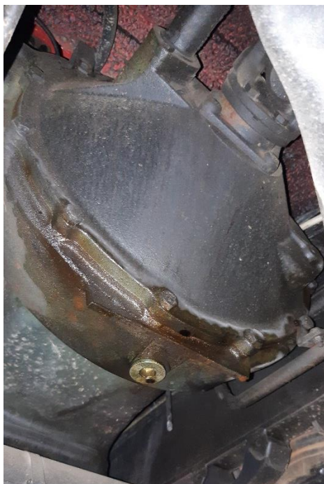
(Prüfbericht Punkt 8.4.1)