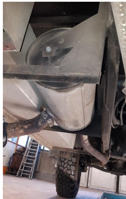
(Prüfbericht Punkt 6.1.2)