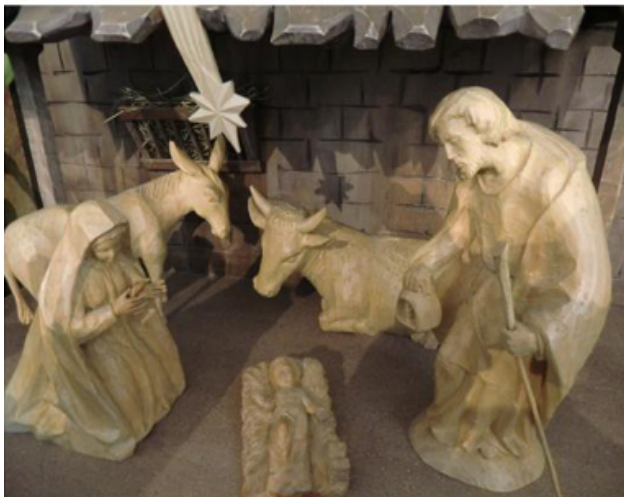
Die neue Krippe am Heiligen Abend 2019