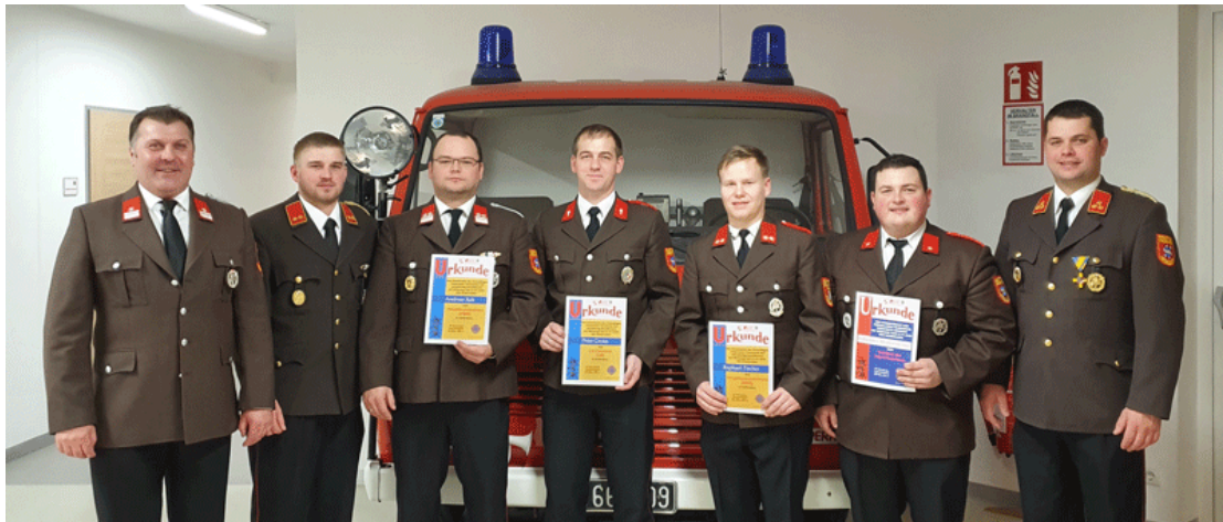
Bildtext: Beförderungen Mitgliederversammlung