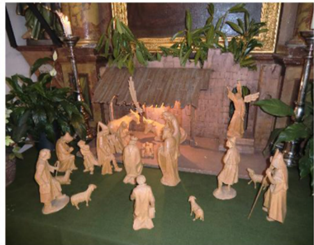
und am 6. Jänner 2020