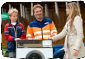
ELEKTRO-GROSSGERÄTE Seitenlänge > 50 cm

Elektrogeräte (EAG) enthalten Schadstoffe einerseits und wertvolle, wiederverwertbare Inhaltsstoffe andererseits - ihnen fällt daher bei der Entsorgung besondere Beachtung zu. Diese werden kostenlos im Altstoffsammelzentrum (ASZ) in der Gemeinde übernommen. Die Profis vor Ort helfen gerne! Unterschieden werden folgende Kategorien: