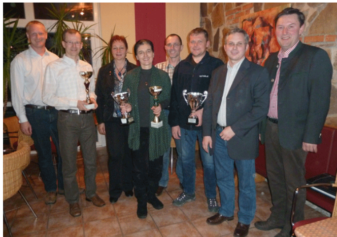
Ehrung der Kilometer-Preisträger Rudern & Paddeln 2012 bei der JHV am 16.3.2013